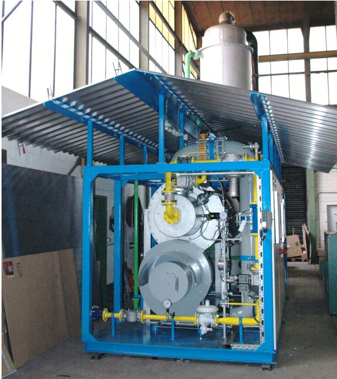
Gesamtansicht eines Exogas-Generators mit einer Produktionsleistung von 3550 Nm 3 /h